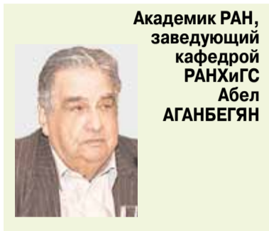
Академик РАН, заведующий кафедрой РАНХиГС Абел АГАНБЕГЯН

ЗАКРЫВАТЬ ВСЕ ПРЕДПРИЯТИЯ И ОРГАНИЗАЦИИ ГОРОДА РАДИ БЕЗОПАСНОСТИ ЕГО ЖИТЕЛЕЙ ИЛИ ВСЁ-ТАКИ ПРОДОЛЖАТЬ РАБОТАТЬ, ЧТОБЫ СПАСТИ ЭКОНОМИКУ И СЕМЕЙНЫЕ БЮДЖЕТЫ? ПЕРЕД ТАКИМ ВЫБОРОМ СЕГОДНЯ СТОЯТ ВСЕ ГЛАВЫ РЕГИОНОВ И МУНИЦИПАЛИТЕТОВ.