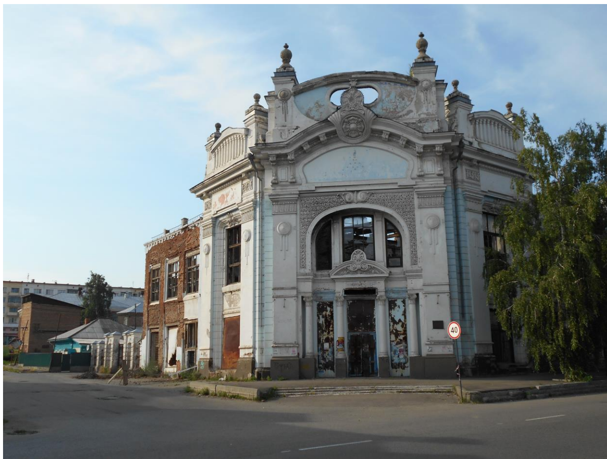
Рисунок 3. Здания-абандоны в старом центре г. Бийск

информационного центра, предприятий торговли, двух комплексов придорожного сервиса, оздоровительного центра, объектов общественного питания, коллективных средств размещения, включая придорожную гостиницу, мотель и мини-отели повышенной комфортности, кемпинга с инфраструктурой (туалеты, душевые, кухня). В дополнение к этому можно рекомендовать реставрацию старых зданий в тихом центре города (см. рисунок 3), либо же развивать направление абандон-туризма (экскурсионные туры по заброшенным зданиям).