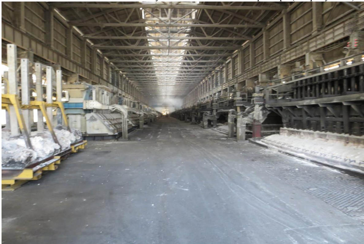
Рисунок 2. Анодный цех частично с новыми электролизерами (слева)

■ Индустриальная диверсификация (г. Новокузнецк) характеризуется следующими особенностями. Во-первых, здесь делается ставка на крупный бизнес при сильном влиянии политики головных офисов холдингов, идет модернизация предприятий-гигантов – обновление технологий с учетом экологического фактора (см. рисунок 2).