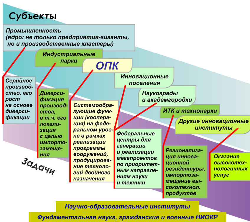
Рис. 2. Региональная «линейка» реиндустриализации: субъекты наукоемкого промышленного производства и их задачи