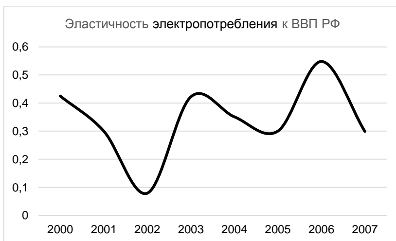
График 1. Динамика эластичности электропотребления по ВВП с 2000 по 2007 гг.

Эконометрическое исследование полученных эластичностей показало незначимость переменной тренда при описании ряда, но выявило значимую гармонику. Это говорит о том, что, вероятно, существует сезонность в изменении эластичности, хотя